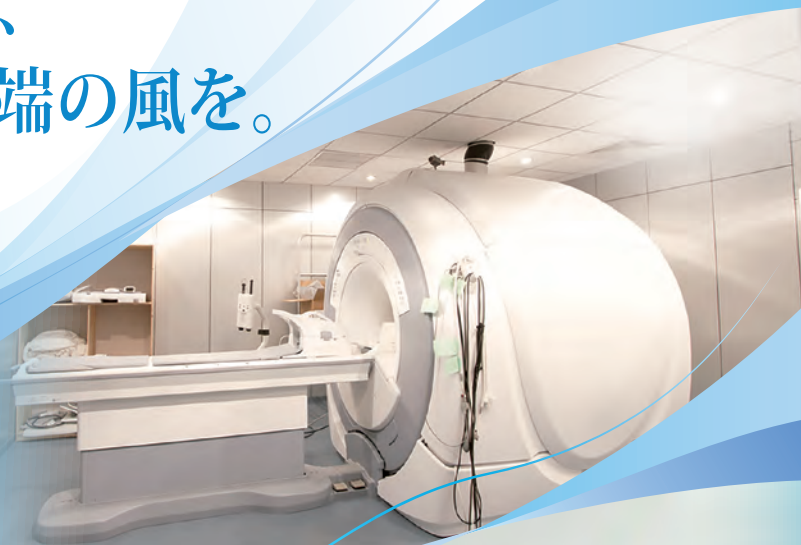
最新鋭のCT・MRIの導入に