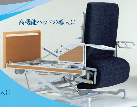
高機能ベッドの導入に