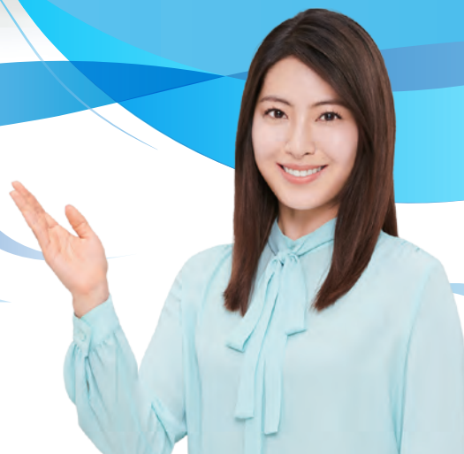
企業イメージキャラクター 瀧本美織